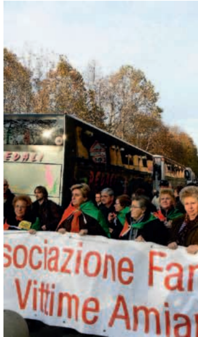
Cittadini casalesi manifestano davanti al tribunale a Torino il giorno della prima udienza (foto di repertorio)

Protesta che ha portato alla fiaccolata e alla serata «Nessun dorma» del 7 gennaio: una partecipazione straordinaria, spontanea e composta, una protesta civica nata dal rifiuto di una proposta vissuta come una ulteriore offesa. E non come una giusta compensazione. Determinante poi l'intervento del ministro della Salute Renato Balduzzi, alessandrino, che lo scorso 21 dicembre ha telefonato al sindaco di Casale